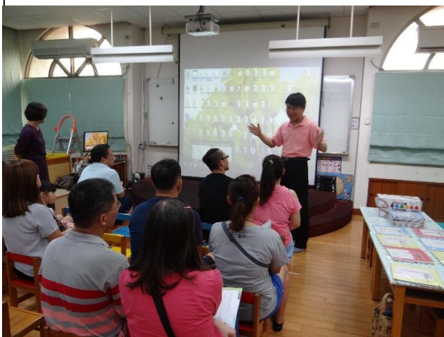
生病不上學 與老師良好溝通