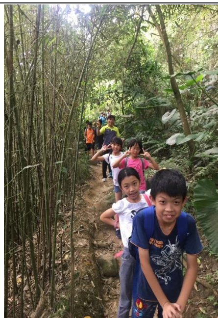
走到校園接觸大自然讓我們更健康