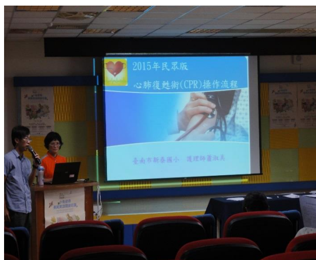
由學校護理師擔任講師