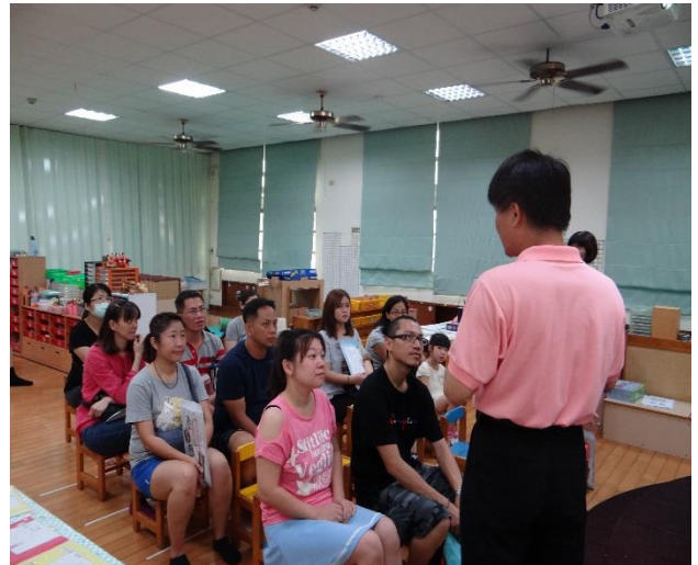
校長為家長介紹學校推廣的健康促進議題