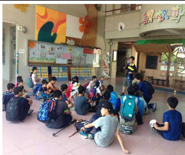
登山活動前安全說明