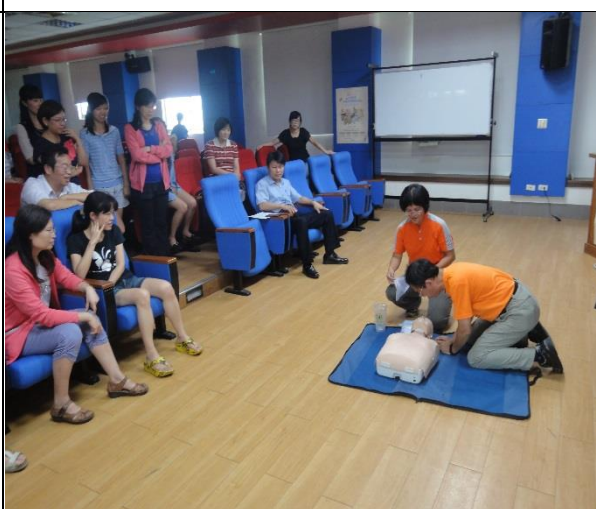
在校長帶領下老師們逐一施測 CPR