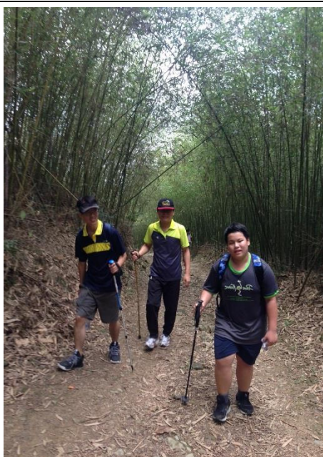
落後同學在校長主任鼓勵下也完成了